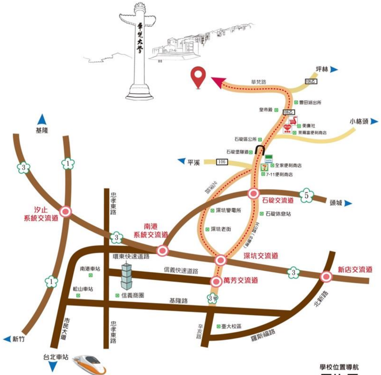
■ 華梵大學交通路線圖