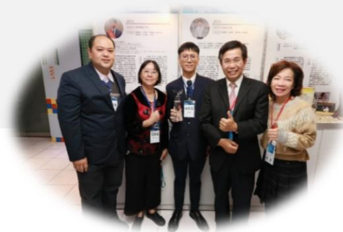
(本校電機工程系學生榮獲技職之光)