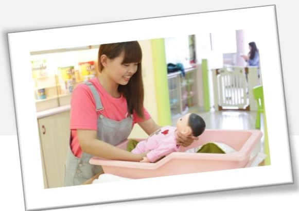
《本校托育人員證照訓練》

上述之申請資料須於報名時一次繳交齊全，凡逾期報名或所附證件不齊全者，一律不予受理，亦不得申請補繳。