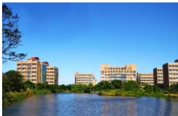
新竹校區 Hsinchu Campus