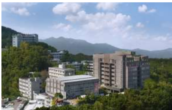
臺北校區 Taipei Campus