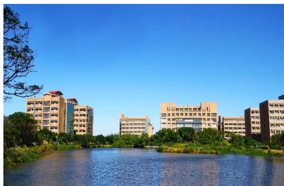
新竹校區 Hsinchu Campus