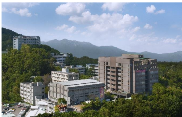
臺北校區 Taipei Campus